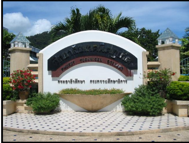
ป้ายวิทยาลัยเทคนิคภูเก็ต